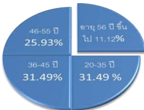
ตารางที่ ๒ แสดงคุณลักษณะผู้ตอบแบบสอบถามของพนักงานเทศบาลจำแนกตามอายุ