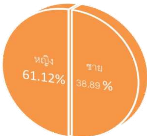
ตารางที่ ๑ แสดงคุณลักษณะผู้ตอบแบบสอบถามของพนักงานเทศบาลจำแนกตามเพศ

แผนภูมิที่ ๑ แสดงคุณลักษณะผู้ตอบแบบสอบถามของพนักงานเทศบาลจำแนกตามเพศ